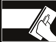
Alisar con COVERPLAST o COVERMIX