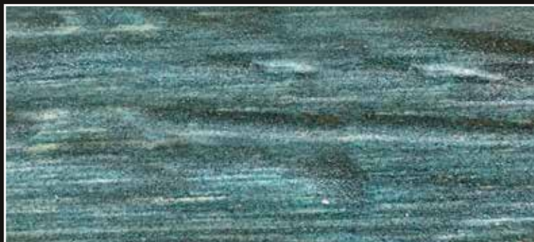
*FR 05 + CÁSCARA N. 100