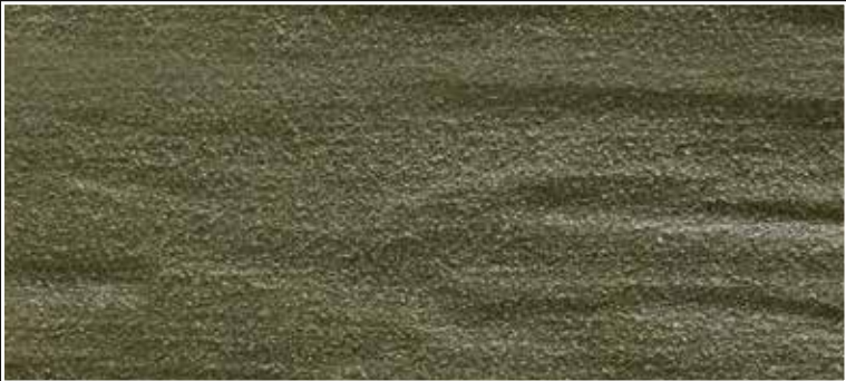
**FR 03 + CASCARA N. 100