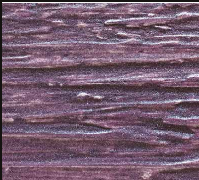
*FR 06 + CÁSCARA N. 100