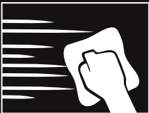
Colocar CÁSCARA DE NARANJA con llana de acero inoxidable, realizar con brocha el acabado de izquierda a derecha, posteriormente pasar el tampon en la misma dirección, formando líneas irregulares. Dejar orear y planchar con espátula.