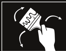
Aplicar FERRÁ con brocha a una o dos manos en el sentido de la textura.