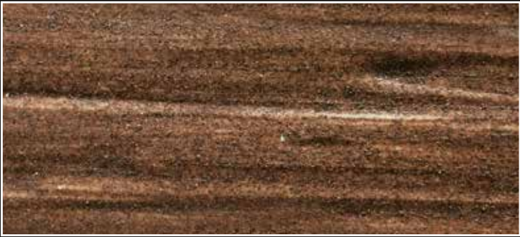
*FR 02 + CASCARA N. 100