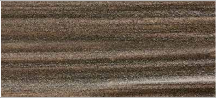
*FR 01 + CASCARA N. 100