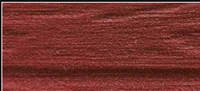
**FR 08 + CÁSCARA N. 100