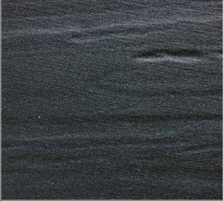
**FR 07 + CÁSCARA N. 100