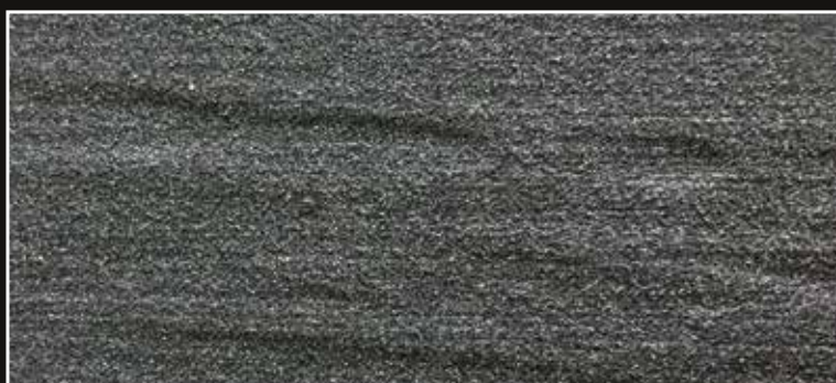
**FR 04 + CÁSCARA N. 100