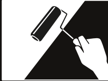
Limpiar la superficie y sellar con SOTTOFONDO 1000, 3xl ó 5xl.